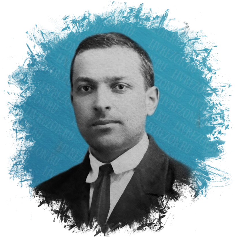
Выготский Л. С.

Ребенок должен попасть в культуру, творить и развиваться в ней!